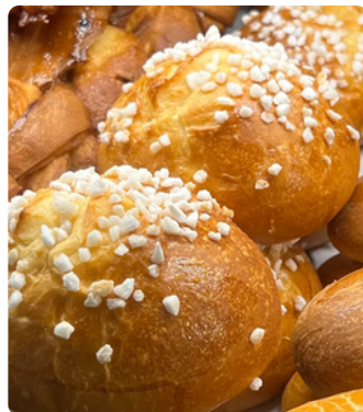
Brioche au sucre