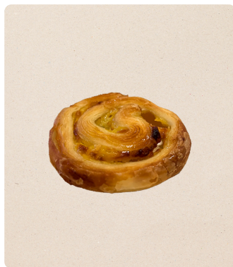
Mini pain au raisin