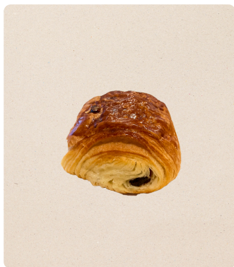
Mini pain au chocolat