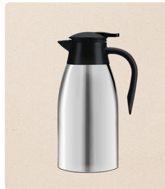
Chocolat chaud (1L)