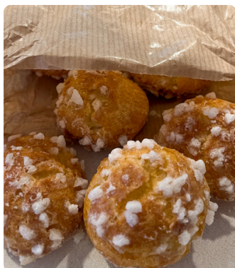
Lot de 10 chouquettes