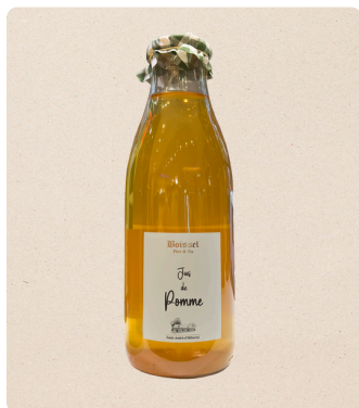
Jus artisanal (1L)